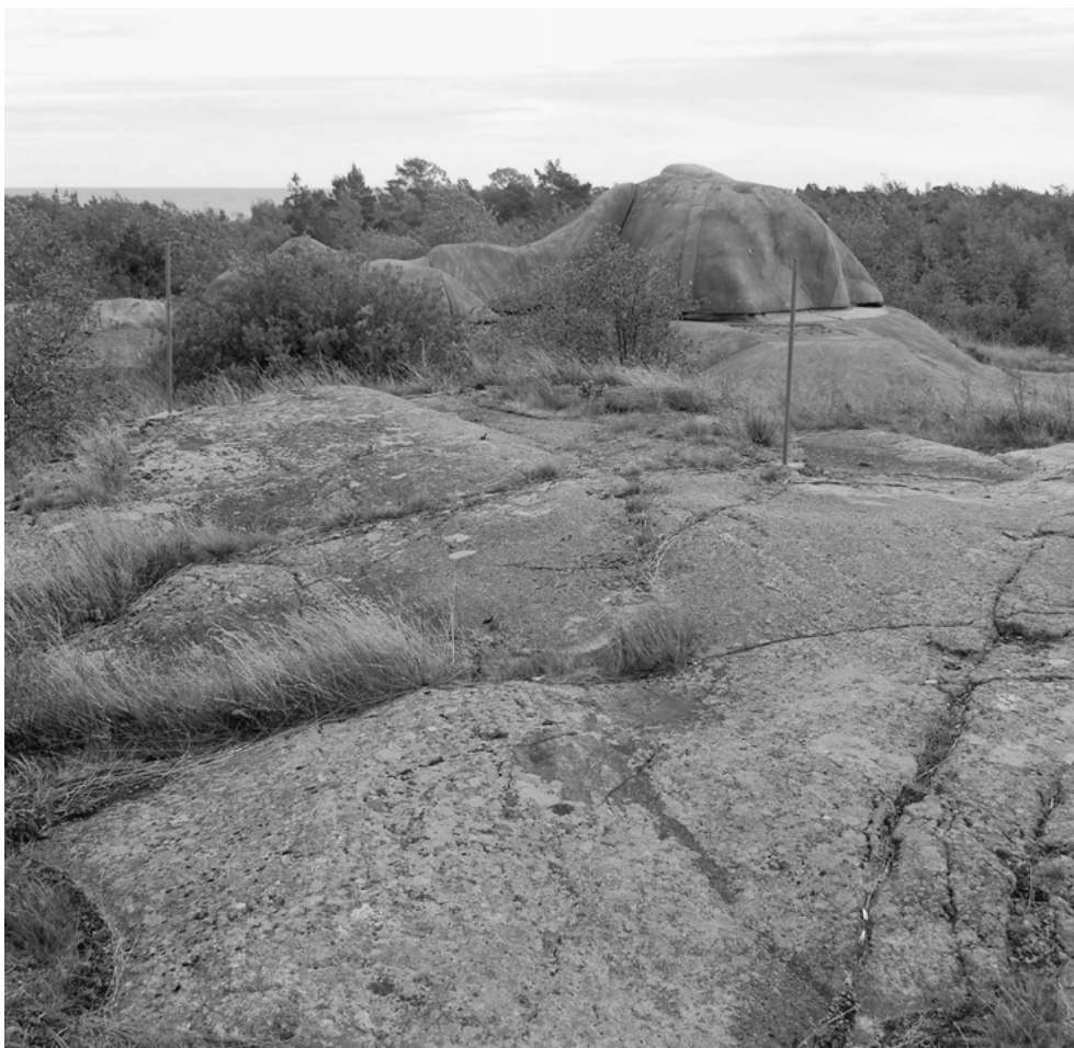
FIGUR 2. Landsort, kustartilleripjäs enligt ERSTA-programmet 1978, ur bruk 2002. Kamouflerat kanonrör.

består av fem med handkraft nedsprängda fort, vart och ett med sitt fullt utrustade underjordiska försörjningssamhälle och omgivet av ett system av skansar, skyttevärn och betonghinder. Kärnan i det hela var garnisonen Boden med sina sju regementen. Om vi höjer blicken ser vi också de fördröjningslinjer som skulle skydda Boden. Enbart den så kallade Kalixlinjen innehöll ett kontinuerligt system av värn från havet till fjällen, totalt mer än 3 000 konstruktioner. Försvarshistoriker, och bodensarna själva, har förstås förstått betydelsen av detta, men det är långt kvar till att Bodens fästning betraktas som en självklar del av den svenska bebyggelsehistorien. Tillsammans med kraftverksutbyggnaderna och råvaruindustrierna skulle Bodens fästnings utgöra en begriplig portal till hela 1900-talets statliga ”stora projekt”.