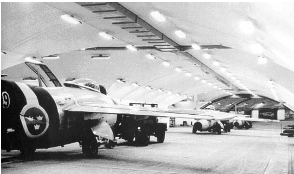
FIGUR 4. Göteborg, Sävebasen "Nya berget" 1955, ur bruk 1999. Jaktflygplan J29 i startberedskap. Foto kring 1960, Krigsarkivet, Förvarsstabens informationsavdelning.

kärnkraftsutbyggnaden, är inte möjliga att förstå om de inte sätts i relation till de stora militära projekten.