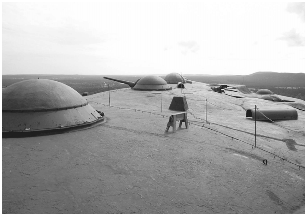
FIGUR 1. Boden, Rödbergsfortets hjässa. Ett av de fem bergsforten byggda 1900-1909, ur bruk 1999.

I MER ÄN TUSEN ÅR har befästningar tydligt manifesterat sig som kraftfulla byggnadsverk i det svenska landskapet. Först anlades försvarsanläggningar som förstärkta naturliga berg, senare som högresta hus, därefter som kringbyggda gårdar med torn och så småningom med allt mer intrikat anlagda vallsystem. Dessa byggnader var bland de första som kom att betraktas som ett svenskt nationellt kulturarv – fornborgarna, de medeltida befästa husen, vasaborgarna, Carlstens, Karlsborgs och Vaxholms fästningar. Den arkitekturhistoriska samlingsbeteckningen för de nationella anläggningarna var oftast riksfästen. Det var byggnadsverk som kunde berätta om Sveriges politiska historia, enskilda livsöden och händelser, men som också kunde vittna om arkitekturens konstnärliga