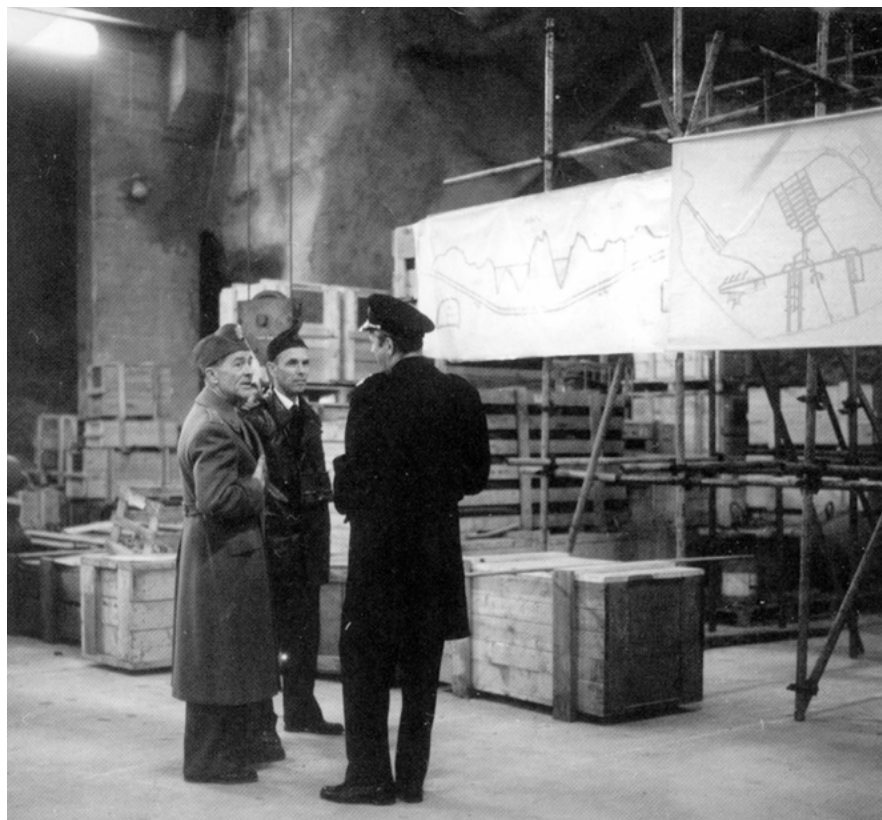
FIGUR 5. Musköbasen. Officerare i samtal framför kartor. Till vänster profilen av den tre km långa landsvägstunneln. Till höger basens planutsträckning i storlek motsvarande Gamla stan och Riddarfjärden. Foto kring 1960. Ur MUSKÖ. EN ÖRLOGSBAS I BERGET.

Inom den internationella kulturarvsforskningen talas ibland om relationen mellan lyckliga minnen och olycklig historia. Ett exempel på detta är hur Nazitysklands gigantiska bunkersystem Atlantvallen har kunnat bli en turistattraktion. Från svensk horisont kan det vara värt att påpeka att de 1900-talsbefästningar som föreslås bli bevarade, och särskilt de från kalla kriget, utgör en försvinnande liten del av allt som byggdes. Som exempel kan nämnas att av de 26 fasta batteriplatser med vardera tre kanoner, som byggdes längs våra