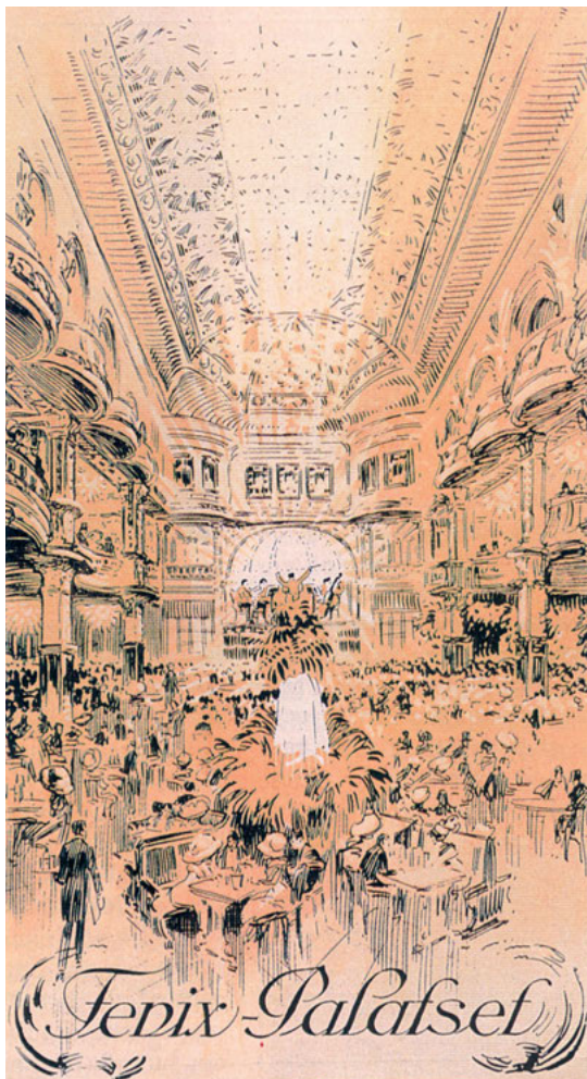
FIGUR 1. Teckningen föreställer musiksalongen och fanns med i programbladet från Fenixpalatsets invigning den 17 januari 1912. Bilden är tagen från Myggans nöjeslexikon, bd 6, s. 15.