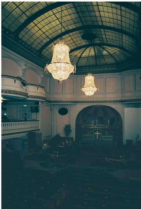
FIGUR 4. Under Fenixpalatsets glansdagar framfördes kabaréer och dans till stor orkester i musiksalongen. Idag används rummet som gudstjänstlokal av Citykyrkan.