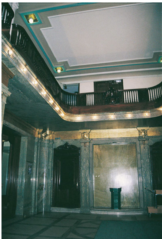
FIGUR 5. (nedan) Entréhallen ger ett maskulint intryck med väggar klädda i grön marmor och räcken samt dörrar i mörk mahogny.

som hände den första pingstdagen i Jerusalem när den heliga anden utgöts över lärjungarna. Dessa andedop, som ofta karakteriseras av tungomålslande, är det enda som ger fullständig visshet om att man har blivit frälst.