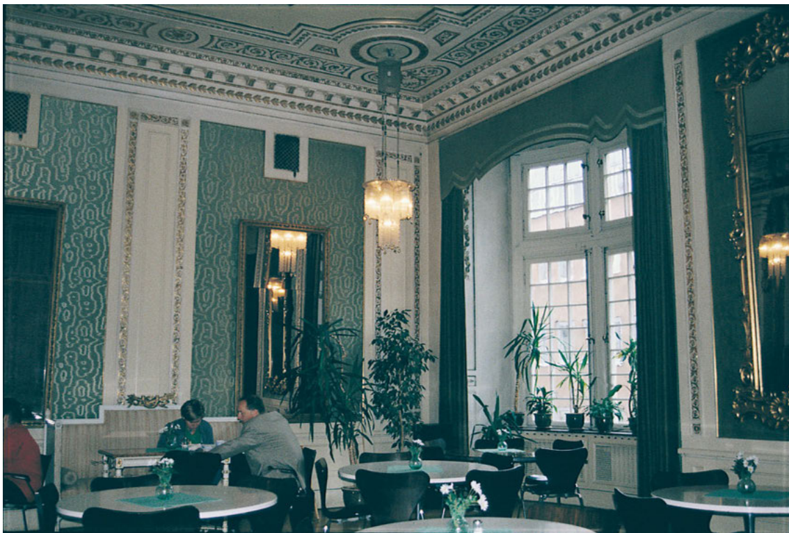
FIGUR 6. I Fenixpalatsets forna bankettsal driver Citykyrkan idag ett kafé.

ret. Med denna inriktning blir all fast organisation onödig eller ses rent av som ett hinder. Det är förklaringen till varför det inte finns någon central förvaltning inom pingströrelsen. I stället är alla församlingar fristående. På samma sätt är det med lokalernas utformning. Det finns inget teologiskt motiv att utsmycka lokalerna eller ge dem en form som påminner om kyrkobyggnader. Gudstjänstlokalen ses bara som ett skal kring församlingen i väntan på andedopet. 19 I Fenixpalatsets musiksalong fann man allt man förväntade sig av en gudstjänstlokal. Här fanns gott om utrymme för sittplatser – både i salongen och på läktaren – och en rymlig scen. Under ett pingstmöte ska ett stort antal personer få plats på scenen: funktionärer, inbjudna talare, frälsta och frälsningssökande. Åsynen av de samlade på scenen tillsammans med talen och sångerna under gudstjänsten är tänkta att försätta församlingen i ett extatiskt tillstånd. 20