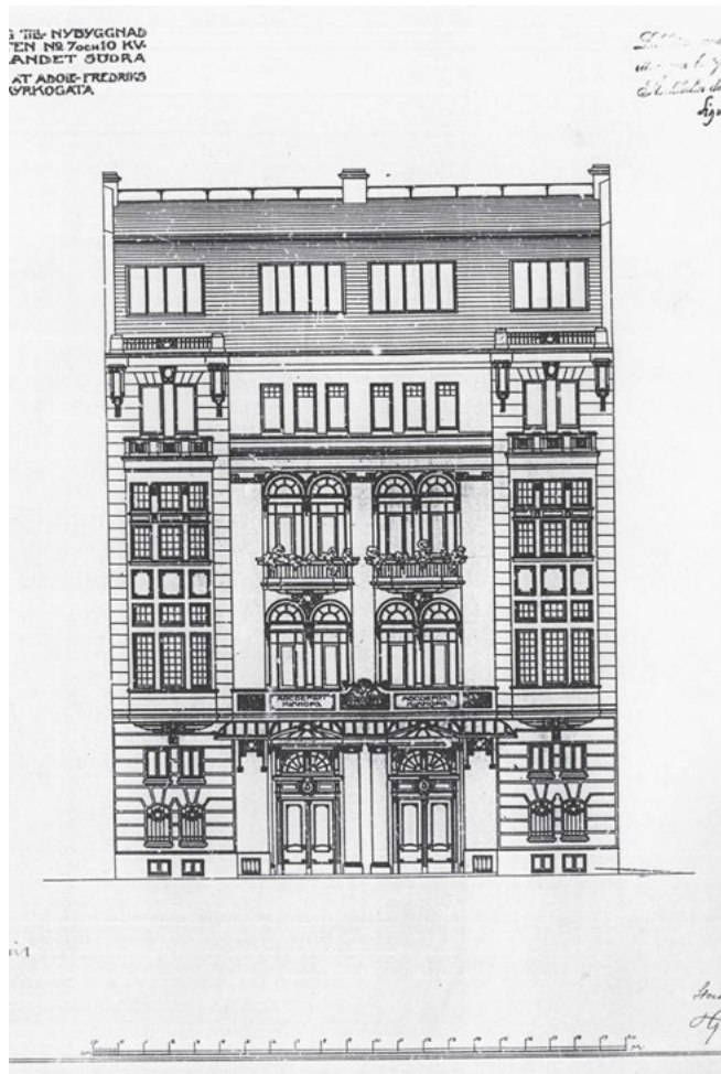
FIGUR 2. Fenixpalatsets fasad mot Adolf Fredriks Kyrkogata smyckades med pilastrar i svartgrå granit och kapital av brons. Fasadritning, Grönlandet 10, Stadsbyggnadsnämndens arkiv, Stockholm.

Rummet är uppbyggt som en teatersalong, med upphöjd scen, läktare och loger. Det som avviker från detta mönster är salongen som inte har ett lutande golv med fasta bänkar utan en slät parkett som genom åren både har tjänat som dansgolv och hyst restaurangbord och stolar. Rummets ut-